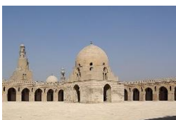
Masjid Ibnu Tulun