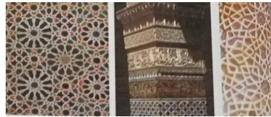
Jaringan sulur geometric